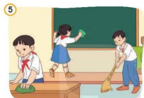
5 Giữ gìn, bảo vệ của công