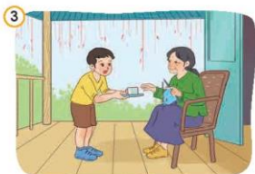
3 Kính trọng, hiếu thảo với ông bà, cha mẹ