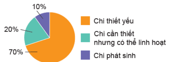
Biểu đồ phân chia tỉ lệ chi tiêu của bạn Thủy