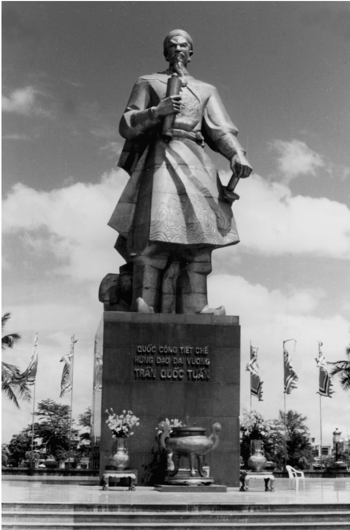
Tượng Hưng Đạo Vương Trần Quốc Tuấn ở Nam Định

Vương Công Kiên (7) là người thế nào, tì tướng của ông là Nguyễn Văn Lập lại là người thế nào, mà giữ thành Điếu Ngư (8) nhỏ như cái đẩu, đường đường chống với quân Mông Kha (9) đông đến hàng trăm vạn, khiến cho nhân dân đời Tống đến nay còn đội ơn sâu !