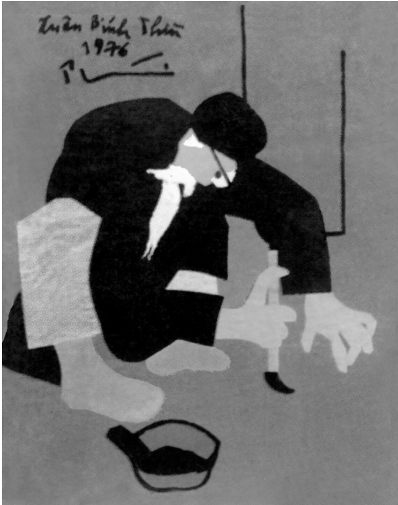
Tranh "Ông đồ" của Bùi Xuân Phái

Mỗi năm hoa đào nở Lại thấy ông đồ (1) già Bày mực tàu (2) giấy đỏ Bên phố đông người qua.