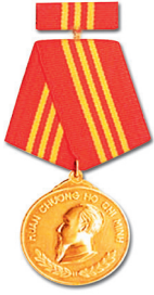
HUÂN CHƯƠNG HỒ CHÍ MINH