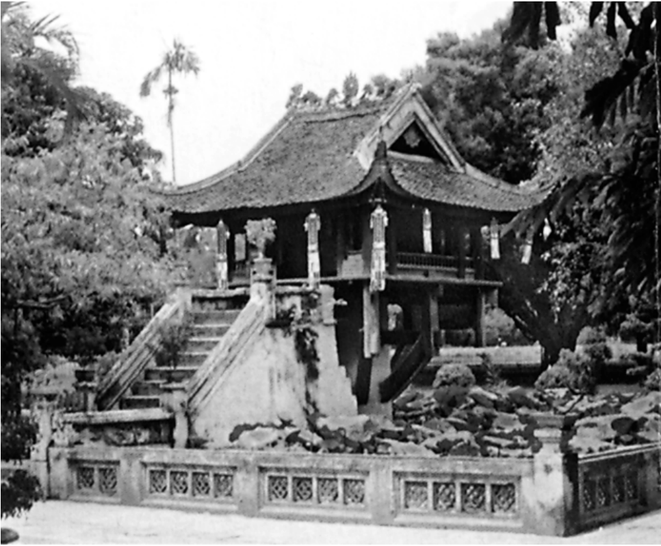
Chùa Một Cột – công trình kiến trúc nổi tiếng của thủ đô Hà Nội được xây dựng từ thời Lí

cho triều đại không được lâu bền, số vận ngắn ngủi, trăm họ phải hao tổn, muôn vật không được thích nghi. Trẫm rất đau xót về việc đó, không thể không dòi dỏi (8) .